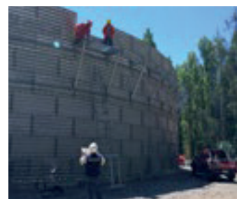
Montaje y/o Asesoría en Terreno

Acero Corrugado ASTM A 760 y 761, Galvanizado en Caliente ASTM A 123, Norma API 650, NCh 2369 para zona sísmica 3 y suelo tipo II