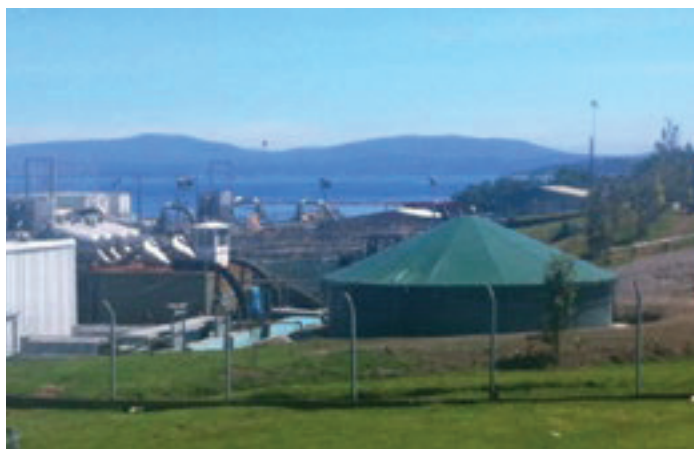
Estanque para agua potable en Quellón