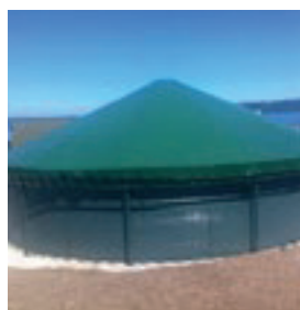
Techos y cubiertas