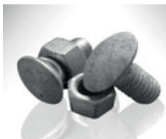
Pernos y tuercas