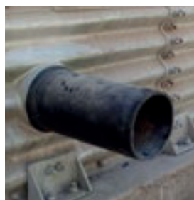
Salida de Tubería