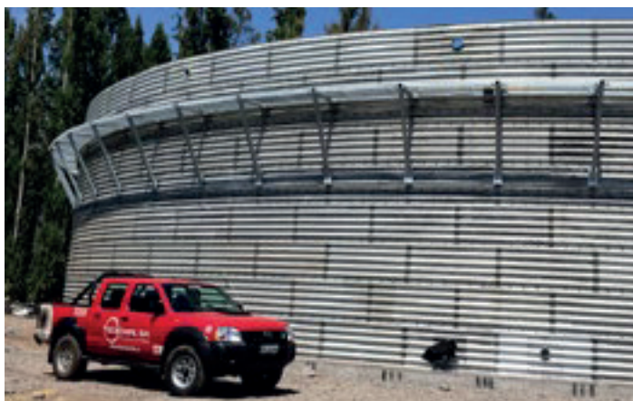
Biodigestor Agrícola AASA

Se realizan proyectos personalizados para responder a todas las necesidades