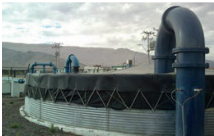
Estanque de Riles Copiapó