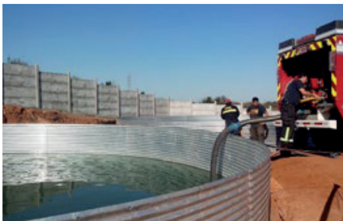
Estanque Incendios Valparaíso