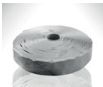
Sello de butilo para garantizar hermeticidad