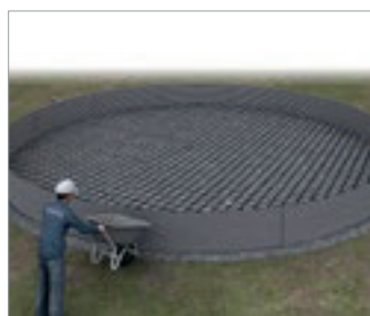
Planos de instalación y especificaciones técnicas