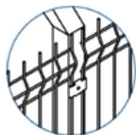
Elementos de Fijación